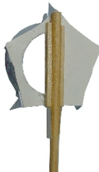
Abbildung: Halterung von hinten (mit aufgeklebten Holzspieß)

Bitte beachten Sie die richtige Reihenfolge beim Zusammenbau der Teile.