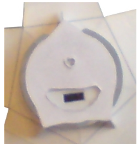
Abbildung: Halterung von hinten (mit Stern)

Bitte beachten Sie die richtige Reihenfolge beim Zusammenbau der Teile.